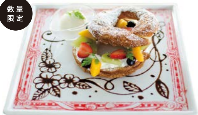
Art Croissant Donut