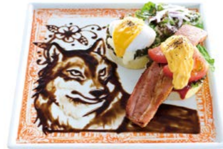
Bacon, Lettuce Tomato Art Eggs Benedict