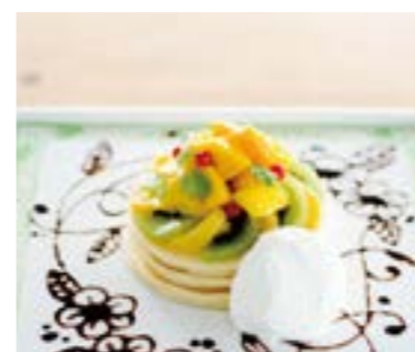
Tropical Fruits Art Pancake

ジューシーでフレッシュな苺を贅沢に使用、ブルーベリーをアクセントにお楽しみいただけます。