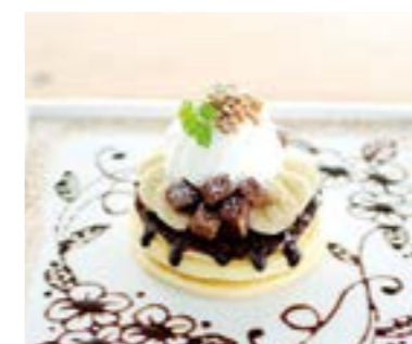
Brownie & Banana Art Pancake