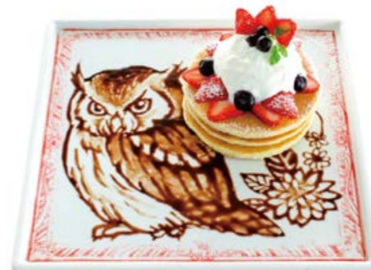
Berry & Berry Art Pancake