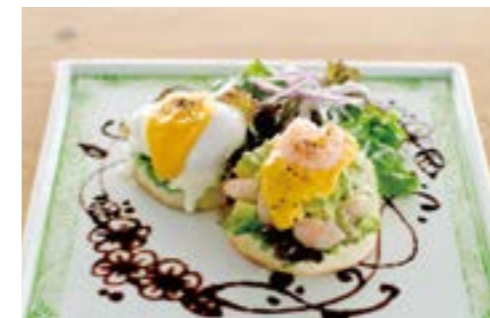
Shrimp & Avocado Art Eggs Benedict