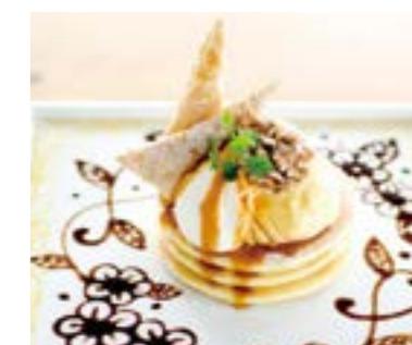
Caramel, Nuts & Custard Art Pancake