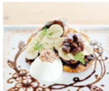
Brownie & Banana Art French Toast