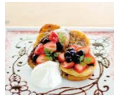
Berry & Berry Art French Toast