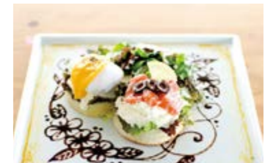
Smoked Salmon & Cream Cheese Art Eggs Benedict