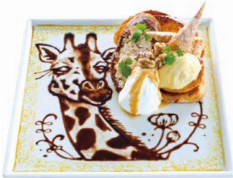
Caramel, Nuts & Custard Art French Toast