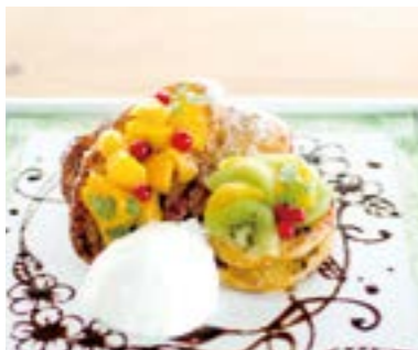
Tropical Fruits Art French Toast

ジューシーな厚切りベーコンにフレッシュなレタスとグリルトマトでボリューム満点な一品です。